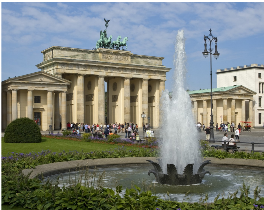
Porte de Brandenbourg

Voyage ouvert aux élèves de 1 ère , 2 ème et 3 ème année comprenant cours d'allemand, visites et temps libre.