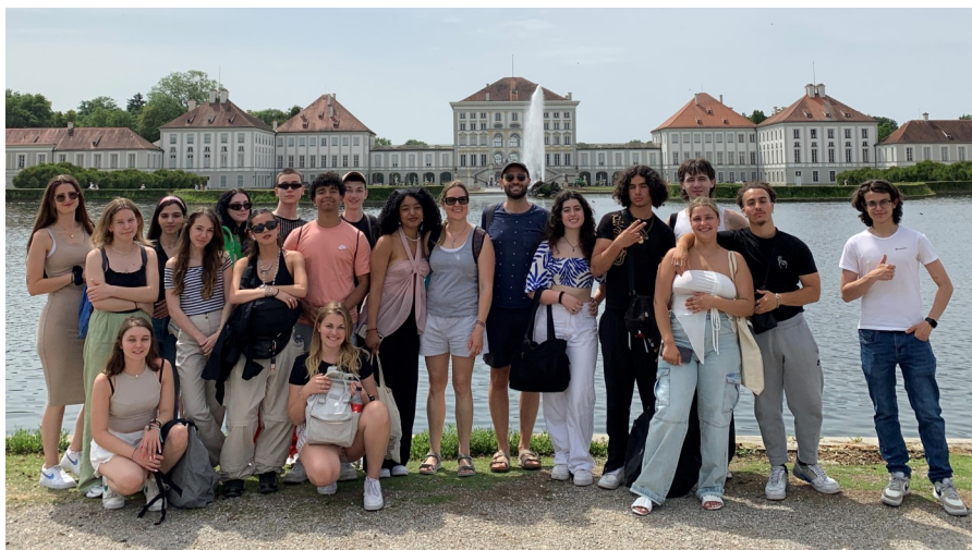
Séjour linguistique 2023 à Munich

Les élèves mineur.e.s ont besoin d'une autorisation de séjour à l'étranger signée par leur représentant légal. Le passeport ou la carte d'identité doit être valable 6 mois après la date de retour (= 23.12.2025).