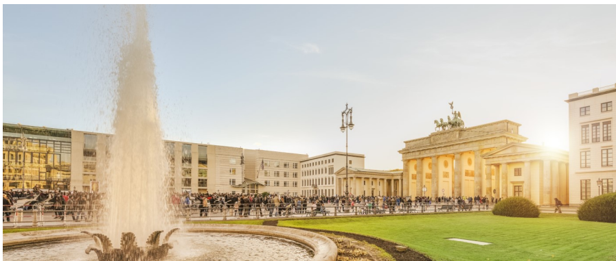
Mitte, Regierungsviertel

* La Direction générale de l'enseignement postobligatoire (DGEP) et son programme de mobilité soutiennent les projets des élèves avec une subvention d'env. CHF 500.- par élève. En cas d'annulation, la DGEP ne peut pas prendre en charge la moitié du séjour. Dans un tel cas, l'élève doit prendre en charge la totalité du voyage et rembourser la part payée par la DGEP de CHF 500.- environ. Une assurance annulation est conseillée.