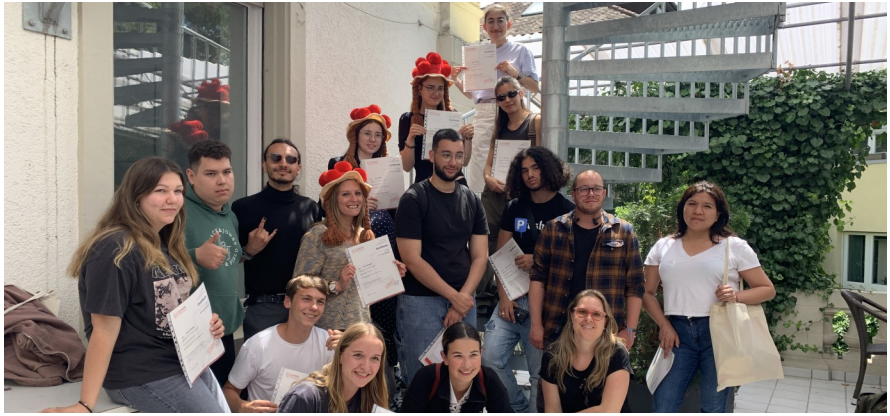
Séjour linguistique 2024 à Fribourg-en-Brisgau

L'école de langue GLS est une école de langue réputée. Son parc est une oasis de verdure dans le centre même de Berlin, dans le quartier branché de Prenzlauer Berg. Berlin est une ville dynamique, qui offre une large variété de visites et d'activités.